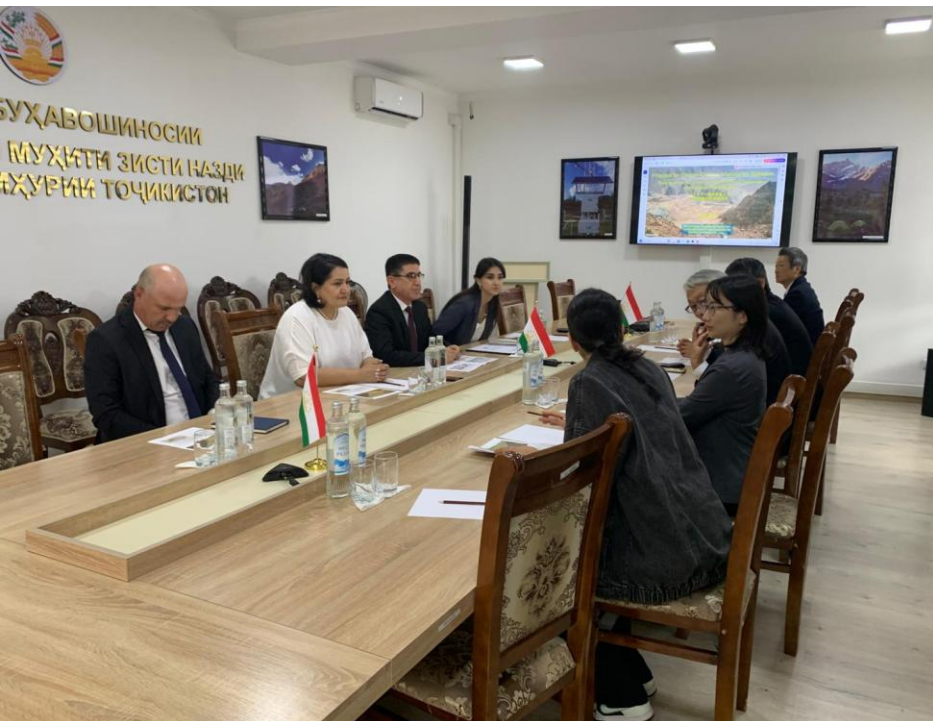
水文気象庁でのプレゼンテーション